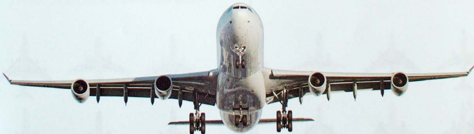
Swiss International Air Lines Airbus A340-300