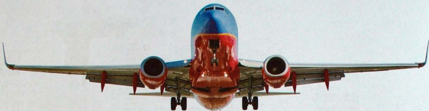
Southwest Airlines Boeing 737-700