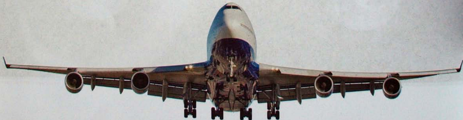
British Air Boeing 747-400

这个问题完全能够演化成一个心理测试：选择隐身的人大概有偷窥欲，或者内心不够开朗；而选择飞翔的人则充满梦想和征服的欲望。