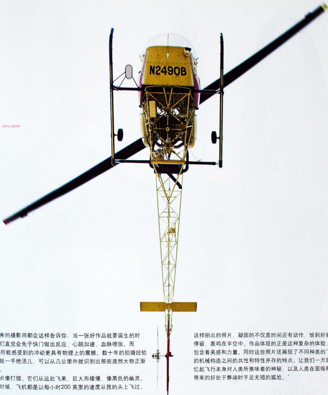
Bell 47G Helicopter

许多优秀的摄影师都会这样告诉你：当一张好作品就要诞生的时候，他们直觉会先于快门做出反应，心跳加速，血脉喷张。而 Milstein 所能感受到的冲动更具有物理上的震撼。数十年的拍摄经验使他练就一手绝活儿，可以从几公里外就识别出那些庞然大物正渐渐逼近。